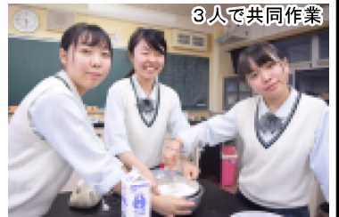
3人で共同作業 青森県立六戸高等学校出版委員会